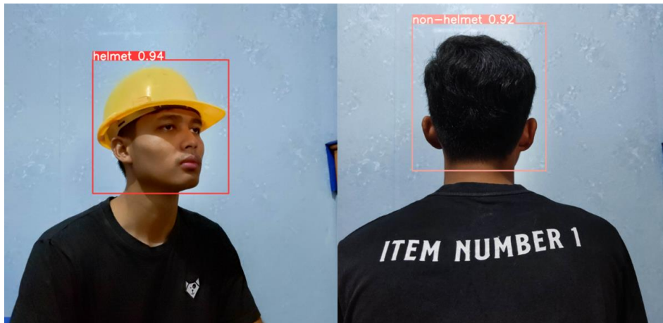
Gambar 5 Hasil Pengujian Dengan Jarak 1 Meter

Pengujian dilakukan menggunakan 100 citra dengan berbagai posisi dan jarak yang berbeda-beda yaitu mulai dari jarak 1, 3 dan 5 meter. Nilai ambang batas atau confidence threshold yang digunakan pada pengujian ini sebesar 0,80 maka bounding box dengan akurasi dibawah 0,80 tidak akan ditampilkan. Hasil pengujian bisa dilihat pada Gambar 5, 6 dan 7 dibawah.