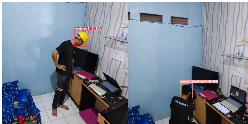
Gambar 6 Hasil Pengujian Dengan Jarak 3 Meter