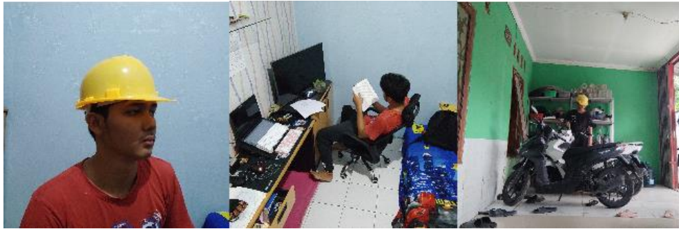
Gambar 2 Contoh Citra

menggunakan helm dan 335 citra yang menampilkan orang tidak menggunakan helm sebagaimana terlihat pada Gambar 2 [16].