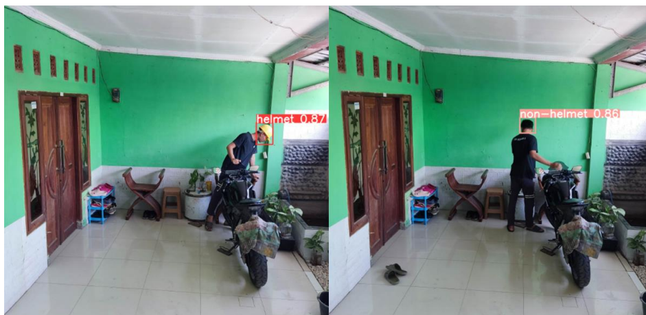
Gambar 7 Hasil Pengujian Dengan Jarak 5 Meter