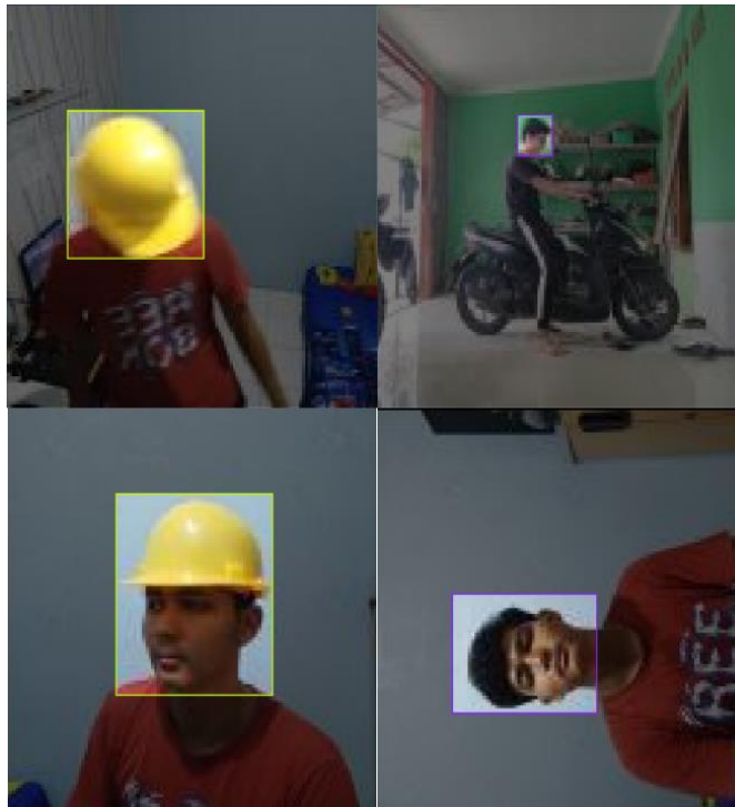
Gambar 3 Hasil Preprocessing

Dilakukan preprocessing yaitu auto orientasi dan resize menjadi 256x256 piksel, dan dilakukan proses augmentasi flip horizontal dan rotasi 90° searah jarum jam dan sebaliknya. Setelah dilakukan preprocessing jumlah data training bertambah menjadi 1.314. Hasil preprocessing dapat dilihat pada Gambar 3.