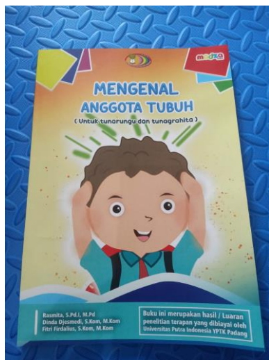
Gambar 9. Gambar Cover Buku

Media pembelajaran berikutnya yang tim peneliti kembangkan yaitu buku pendamping dari aplikasi yang telah dikembangkan. Buku tersebut berjudul “Mengetahui Anggota Tubuh (untuk tunarungu dan tunagrahita). Aplikasi dan buku yang telah dibuat oleh peneliti dilengkapi juga dengan terjemahan ke dalam bahasa Inggris. Hal ini bertujuan untuk memperkenalkan siswa berkebutuhan khusus tersebut dengan bahasa internasional tersebut. Berikut tampilan cover bukunya dan juga isinya.