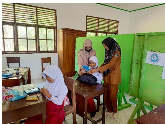
Gambar 14. Praktek secara langsung kepada siswa SDLBN 1 Lengayang

Sedangkan penilaian terhadap siswa dilakukan pengamatan dan praktek secara langsung, seperti pada Gambar 14.