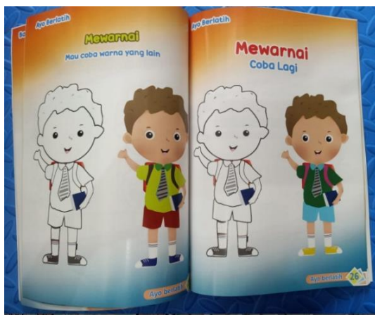
Gambar 10. Gambar Buku Bagian Mewarnai

Didalam buku tersebut siswa berkebutuhan khusus tersebut belajar tentang mengenal bagian tubuh, mengenal pancaindra, dan jari-jari kita. Untuk menambah ketertarikan siswa, dibuku ini peneliti juga memberikan beberapa latihan-latihan singkat, mewarnai, dan nyanyian yang bisa mereka kerjakan di akhir pembelajaran.