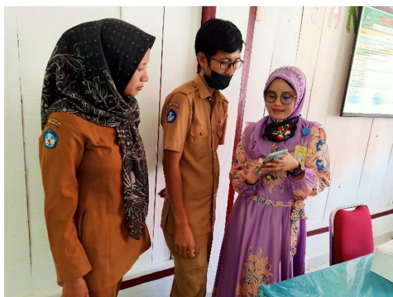
Gambar 13. Pelatihan secara langsung kepada guru SDLBN 1 Lengayang

Pada tahap pengujian ini dilakukan secara langsung baik untuk guru maupun siswa. Gambar 13. dibawah ini, guru diberi pelatihan penggunaan media pembelajaran secara langsung.