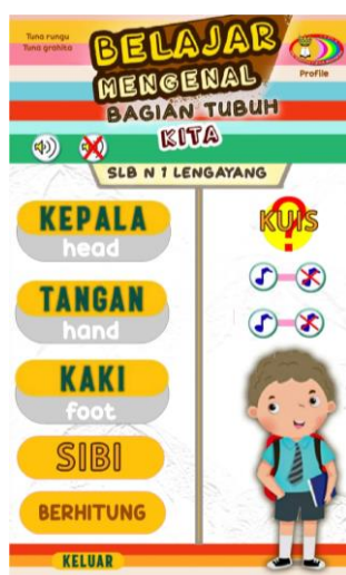
Gambar 2. Tampilan Menu

Pada Gambar 2. merupakan tampilan menu yang menyediakan pilihan menu untuk user yang memilih menu yang ada pada aplikasi android SLBN 1 Lengayang.