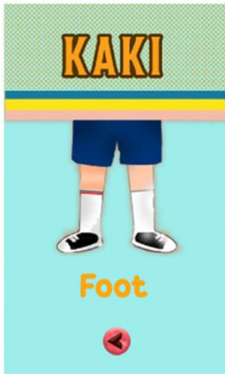
Gambar 5. Tampilan Bagian Kaki

Gambar 5. tampilan menu anggota tubuh bagian kaki pada aplikasi android SLBN 1 Lengayang. Sehingga siswa dapat melihat bagian dari anggota tubuh yang ada dikaki.