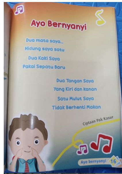
Gambar 11. Gambar Halaman Buku Menyanyi

Buku penunjang ini juga terdapat bagian untuk menyanyi bersama seperti pada Gambar 11. Lagu yang ada dibuku juga ada di aplikasi, sehingga memudahkan guru dan siswa untuk menyanyi bersama. Menyanyi merupakan salah satu cara untuk meningkatkan ketertarikan siswa untuk belajar.