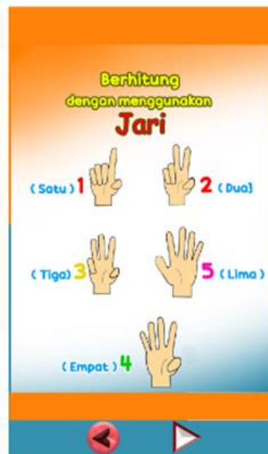
Gambar 8. Gambar Tampilan Berhitung Jari

Gambar 8. merupakan tampilan berhitung pada aplikasi android SLBN 1 Lengayang. Ini merupakan salah satu fitur untuk siswa dapat mengetahui angka dan mempraktekan secara langsung dengan menggunakan jari untuk berhitung.