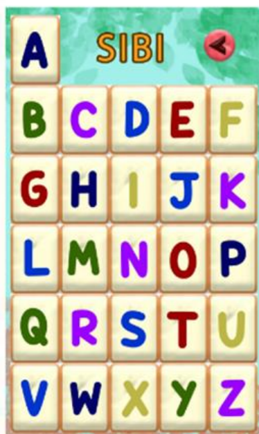
Gambar 6. Tampilan Bagian Kaki

Gambar 6. tampilan menu SIBI pada aplikasi android SLBN 1 lengayang. Sehingga siswa dapat melihat dan mengetahui huruf – huruf SIBI dari A sampai Z.