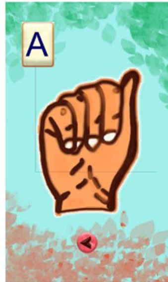
Gambar 7. Gambar Sibi Huruf A

Gambar 6. tampilan menu SIBI pada aplikasi android SLBN 1 lengayang. Sehingga siswa dapat melihat dan mengetahui huruf – huruf SIBI dari A sampai Z.