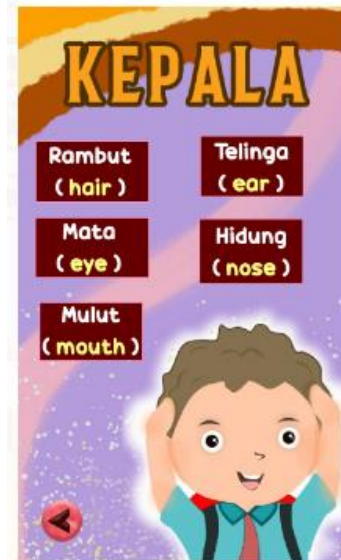
Gambar 3. Tampilan Bagian Kepala

Gambar 3. tampilan menu anggota tubuh bagian kepala pada aplikasi android SLBN 1 Lengayang. Yang terdiri dari menu anggota tubuh kepala seperti rambut, mata, mulut, telinga dan hidung. Sehingga siswa dapat melihat dan mempraktekan langsung bagian dari anggota tubuh yang ada dikepala.