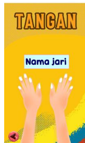
Gambar 4. Tampilan Bagian Tangan

Gambar 3. tampilan menu anggota tubuh bagian kepala pada aplikasi android SLBN 1 Lengayang. Yang terdiri dari menu anggota tubuh kepala seperti rambut, mata, mulut, telinga dan hidung. Sehingga siswa dapat melihat dan mempraktekan langsung bagian dari anggota tubuh yang ada dikepala.