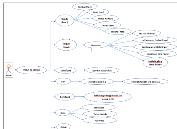
Gambar 1. Use Case Diagram

Untuk perancangan media pembelajaran ini, penulis menggunakan Unified Modeling Language (UML) sebagai media penjabaran sistem. Use Case diagram menggambarkan interaksi antara user dan sistem. Maka didapatkan satu use case diagram yang menggambarkan interaksi use case diagram dengan user.